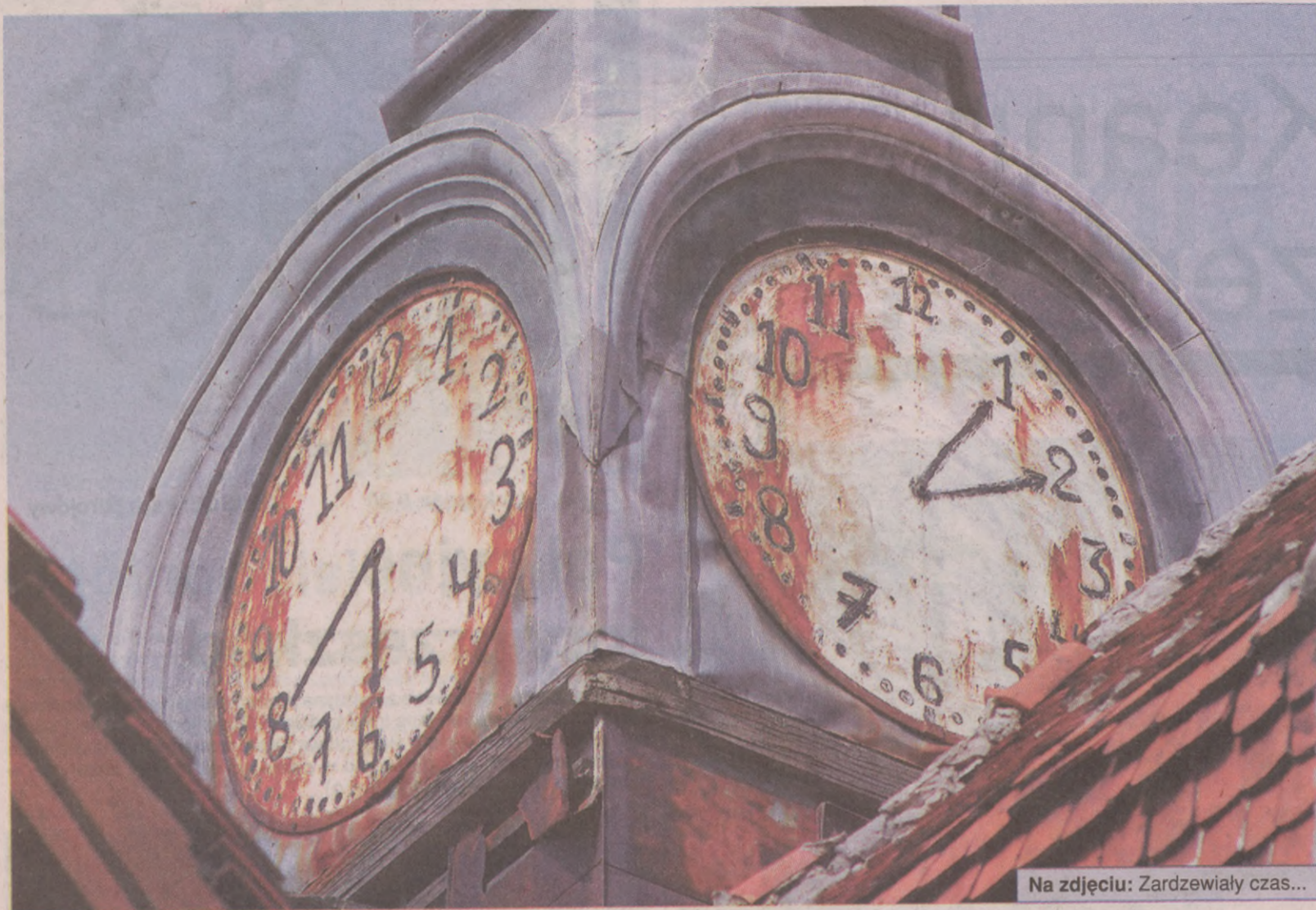
Na zdjęciu: Zardzewiały czas...