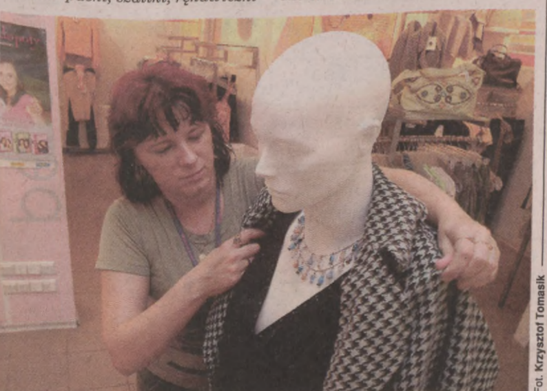
Na zdjęciu: W słupskich sklepach kończą się letnie wyprzedaże i w witrynach zaczyna królować jesienna kolekcja.