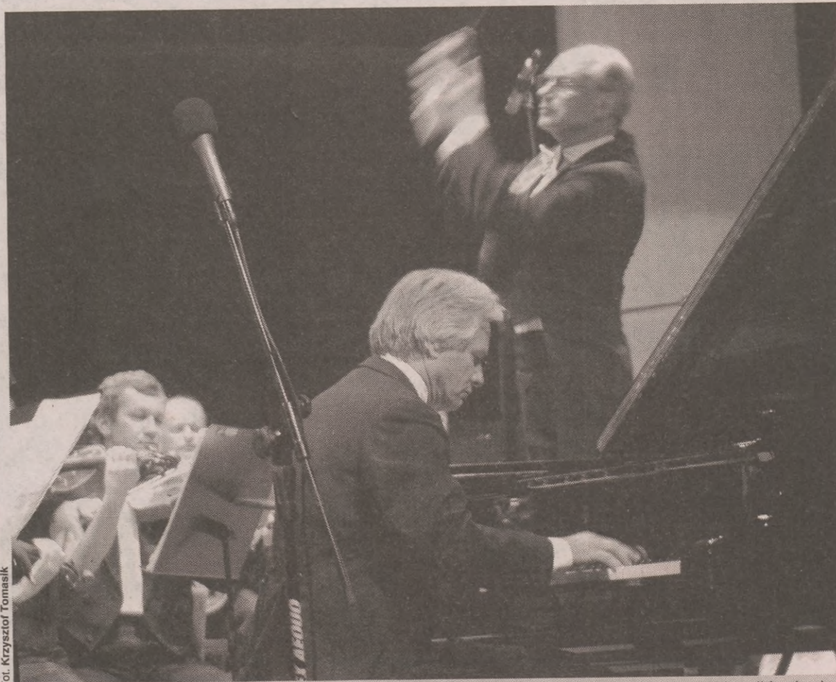
Na zdjęciu: Miłośnicy pianistyki nie będą mogli narzekać na nudę. Artyści po raz pierwszy w historii festiwalu zagrają też „pod chmurką”.