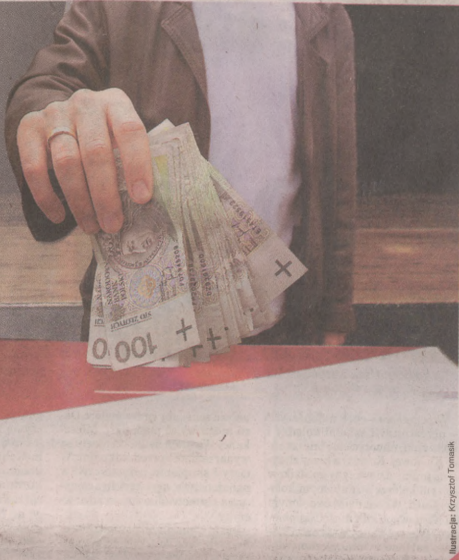
Ilustracja: Krzysztof Tomasiak

Na ilustracji: Pieniądze, i to duże, wciąż są nieodłącznym elementem polskich wyborów. Jeśli kandydat chce, by wyborca oddał na niego głos przy urnie, musi sporo zainwestować. Najpierw w miejsce na liście, a później w kampanię.