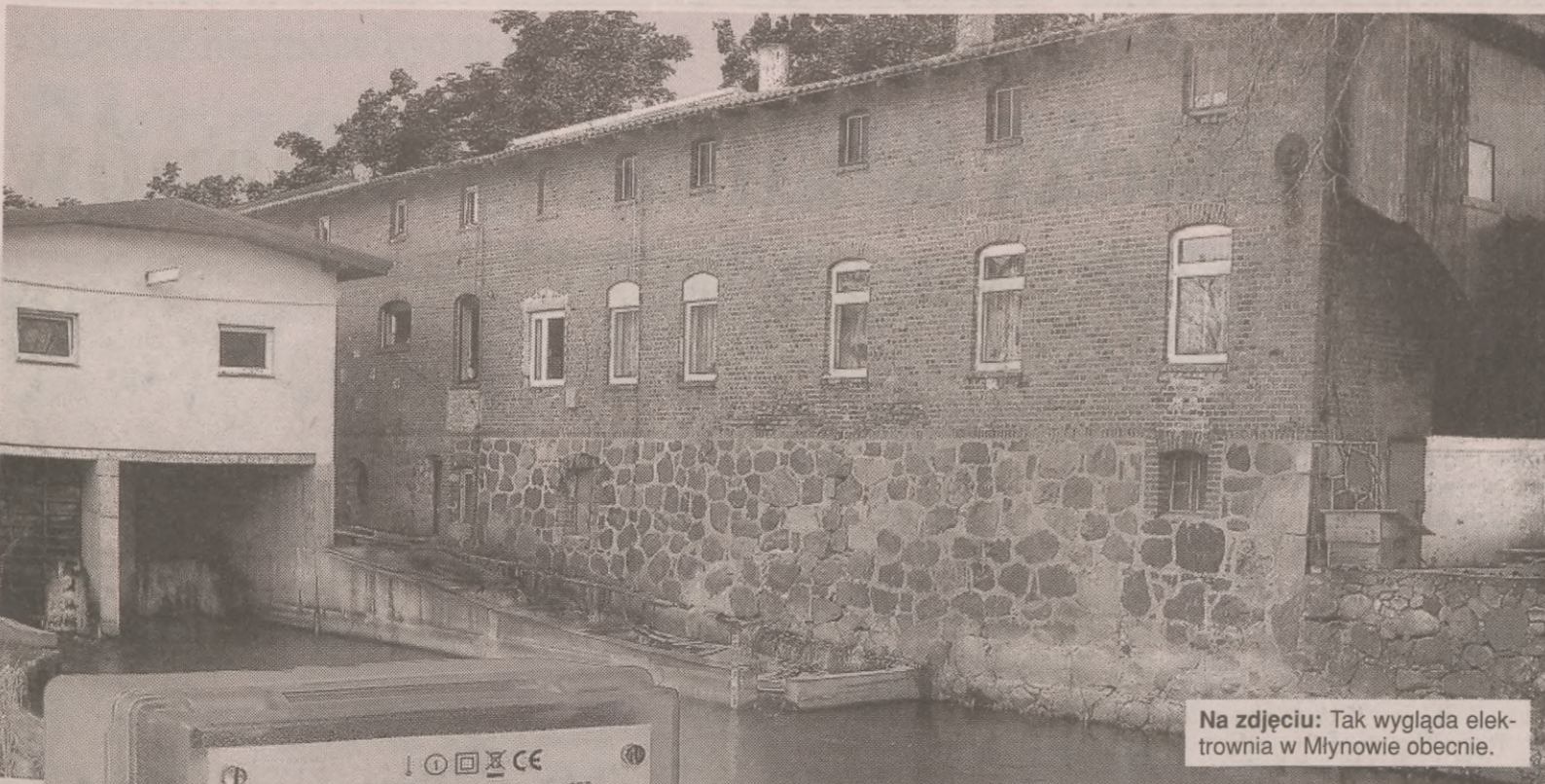
Na zdjęciu: Tak wygląda elektrownia w Młynowie obecnie.

Elektrownia nie produkowała energii, a tylko ją pobierała