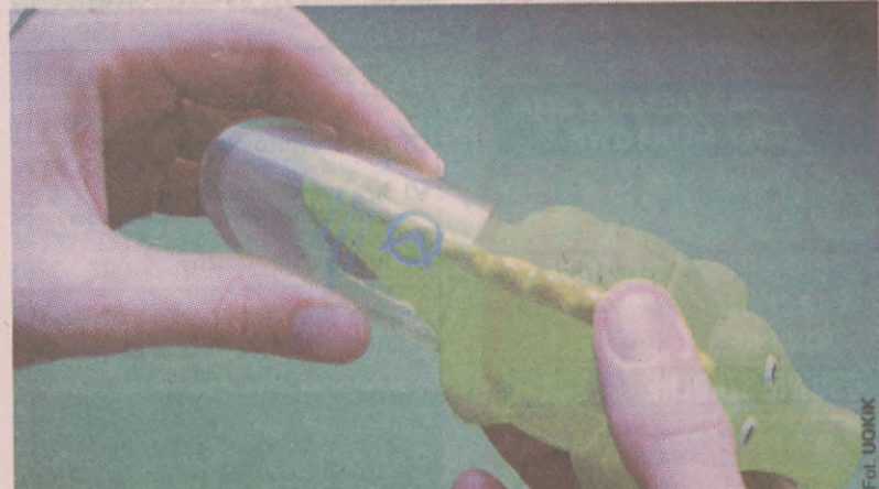
Na zdjęciu: Przy pomocy cylinderka sprawdza się, czy zabawką może się udławić małe dziecko.

Na konieczność zwracania uwagi na oznakowanie produktów przeznaczonych dla dzieci wskazują wyniki kontroli przeprowadzonej przez podległą Prezesowi UOKiK Inspekcję Handlową. Wykazała ona, że aż 52,4