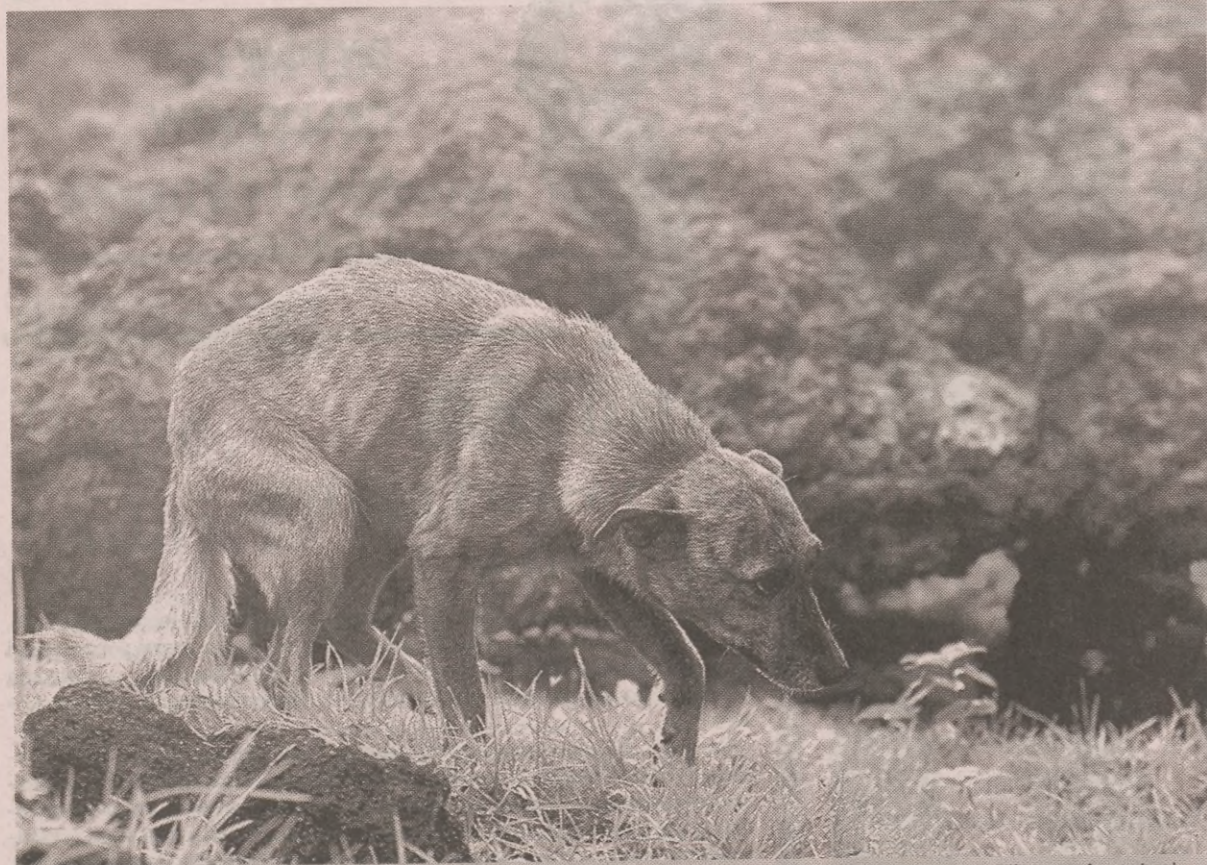
Na zdjęciu: Wystraszony pies przechodzi koło lawy wypływającej z wulkanu Pacaya, 50 kilometrów od miasta Gwatemala; na zboczach wulkanu mieszka 500 rodzin.