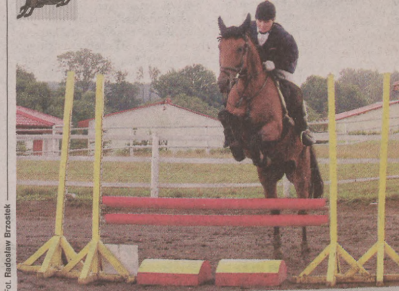
Na zdjęciu: Jeźdźcy i konie będą rywalizować w czterech klasach.

Uczniowski Klub Jeździecki Lida Lulewiczki organizuje Regionalne Zawody Jeździeckie w skokach przez przeszkody o Puchar Burmistrza Białogardu. Impreza odbędzie się w niedzielę (10 bm.) na terenie Stajni Szczytnicki Lulewiczki koło Białogardu.