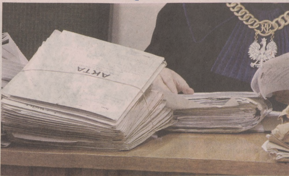
Na zdjęciu: Kontrola pod względem karalności obejmie 150 tysięcy urzędników w Polsce, pracujących w urzędach marszałkowskich, starostwach, gminach. W samym słupskim ratuszu będzie sprawdzonych 280 urzędników – od młodszego referenta do prezydenta. Mimo że samorzady nie zapłacą ze swojej kasy za informacje z Krajowego Rejestru Karnego, to i tak całą akcję sfinansują pieniądze podatników.