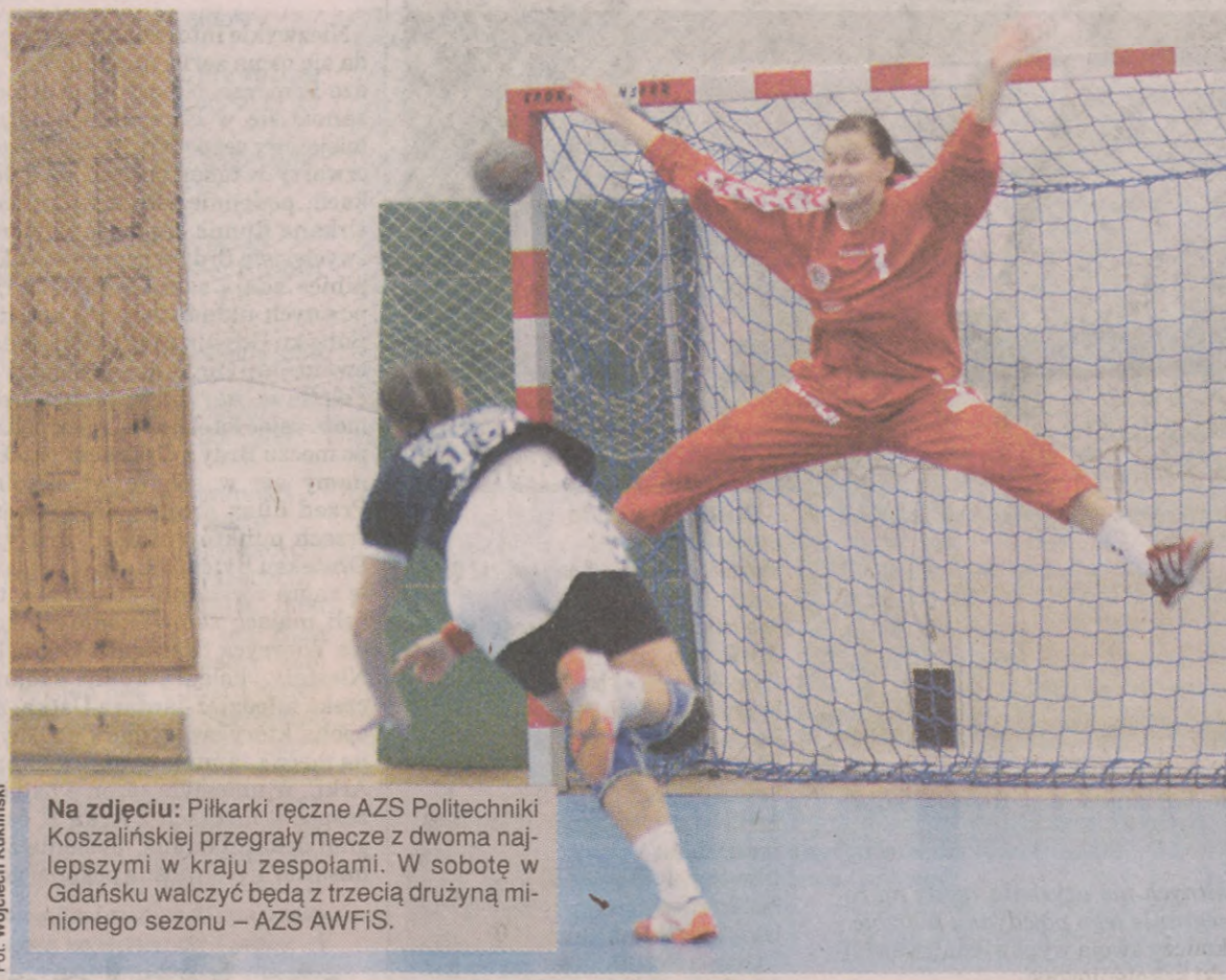
Na zdjęciu: Piłkarki ręczne AZS Politechniki Koszalińskiej przegrały mecz z dwoma najlepszymi w kraju zespołami. W sobotę w Gdańsku walczą będą z trzecią drużyną minionego sezonu – AZS AWFIS.

Przypomnijmy, że odmłodzony zespół z Koszalin w tym sezonie ma za cel uplasowanie się w rozgrywkach ekstraklasy na miejscach 6–8. (wok)