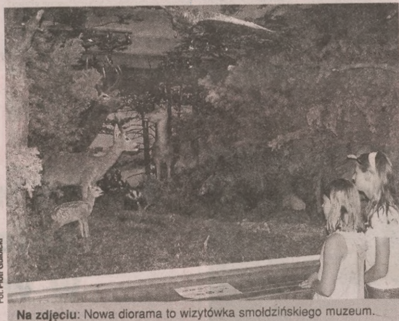
Na zdjęciu: Nowa diorama to wizytówka smoldzińskiego muzeum.

budować? – irytuje się R. Brodowski odpowiada na to ze spokojem, że lotnisko projektuje się i buduje 20 lat, aby potem służyło przez kolejnych 80 lat. Natomiast H. Poleszak mówi, że według ministerialnych wyliczeń utrzymanie takiego lotniska jak w Redzikowie, będzie kosztowało około 4,5 mln złotych rocznie. Wójt Chmiel już teraz myśli jak zarobić na całym okolicy lotniskowym otoczeniu, aby spółka zdołała utrzymać podniebną komunikację. (LL)